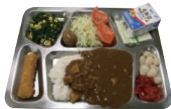
海上自衛隊艦船のカレー

海上自衛隊で提供されるカレーメニューは栄養バランスにすぐれており、ボリュームたっぷり。海軍カレー登録店でも、海上自衛隊のカレーレシピを参考としたメニューを提供する店舗もあります。