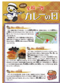
「全校一斉カレーの日」のチラシ

2万3千人以上の生徒・児童がカレーについて考える、“カレーの街よこすか”が誇る学校教育とのタイアップ事業なのです。