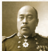
高木兼寛

平成11年5月20日には横須賀市は「カレーの街」を宣言しました。これが全国的にも初の試みとなる、横須賀市役所・横須賀商工会議所・海上自衛隊が協力して行う「カレーによる街おこし事業」のスタートとなりました。